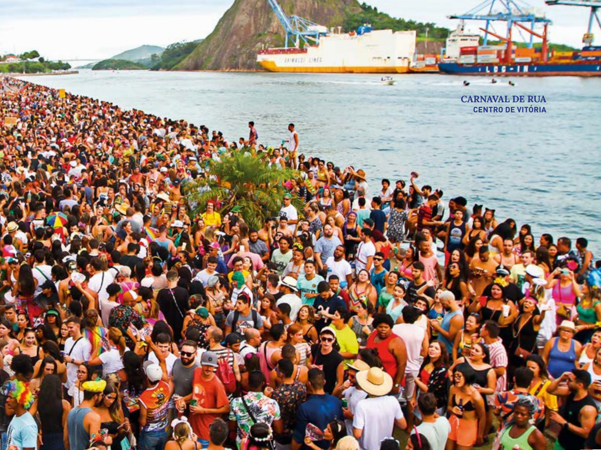
CARNAVAL DE RUA CENTRO DE VITÓRIA