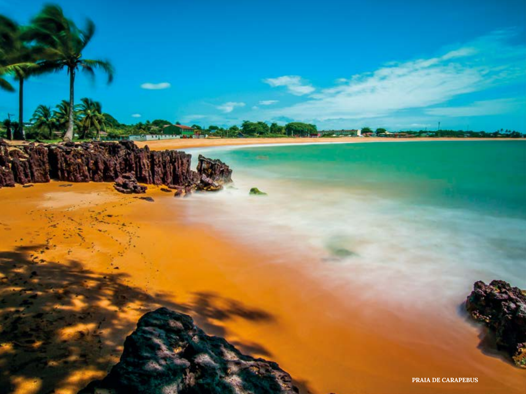
PRAIA DE CARAPEBUS