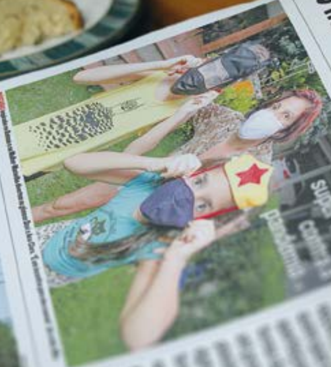
Mascaramas em Super-mercado para controle de contaminação